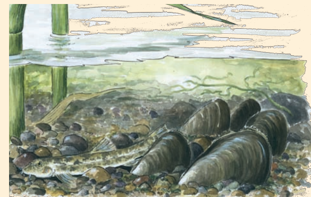
Illustration: Maria Nilsson, www.ritverk.se

Saxån är ett nationellt särskilt värdefullt vattendrag p g a sitt meandrande förlopp och som viktig vandringsled för havsöring. I ån finns dessutom t ex grönling och sandkrypare men också den hotade arten tjockskalig målarmussla.