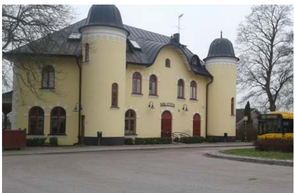
Foto på den norra fasaden