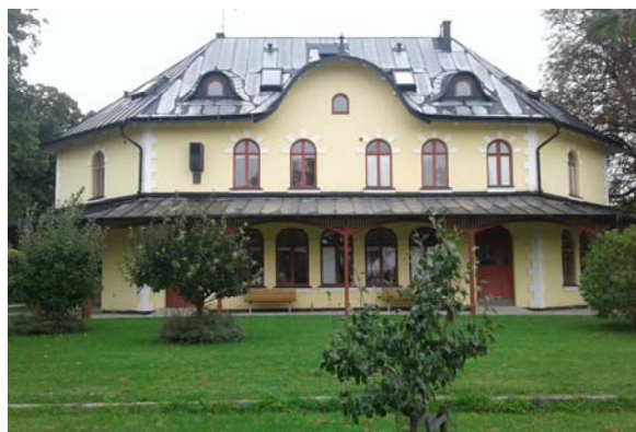
Foto på den södra fasaden