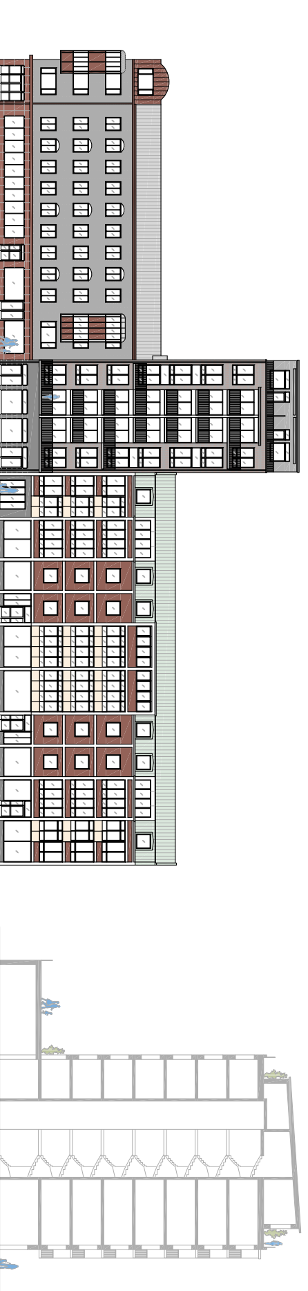
ILLUSTRATION PÅ FASADER MOT STORA TORG