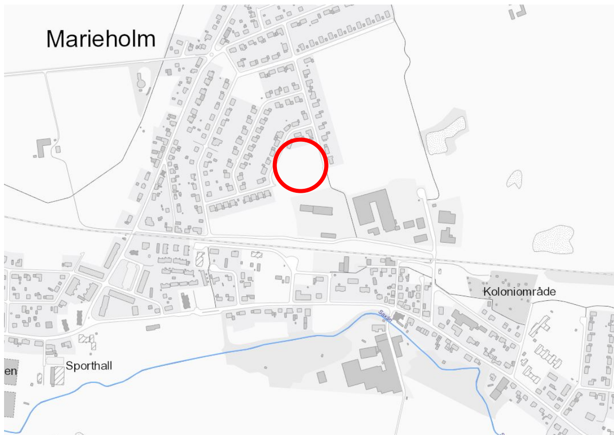
Figur 1. Orienteringskarta för planområdet. Planområdet är beläget inom röd heldragen cirkel.