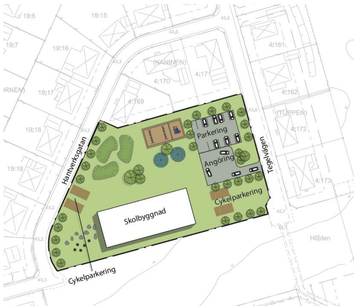
Figur 3: Schematisk bild över ett av flera tänkbara utbyggnadsalternativ som detaljplanen möjliggör.