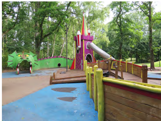
Figur 7. Trollsjön lekplats är idag den enda utflyktslekplatsen på allmän platsmark.

En utflyktslekplats är en lekplats för barn i alla åldrar där fler än tjugo barn kan vistas samtidigt utan risk för konflikter. Lekplatsen ska kunna