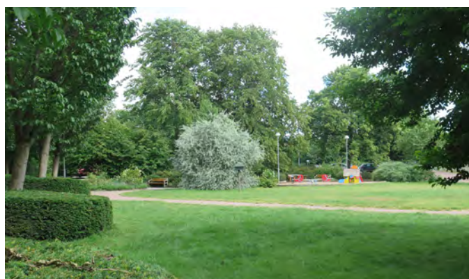
Figur 6. Badhusparken lekplats ligger strategiskt i en parkmiljö med oprogrammerade ytor och mycket annat som bidrar till en bra lekmiljö.