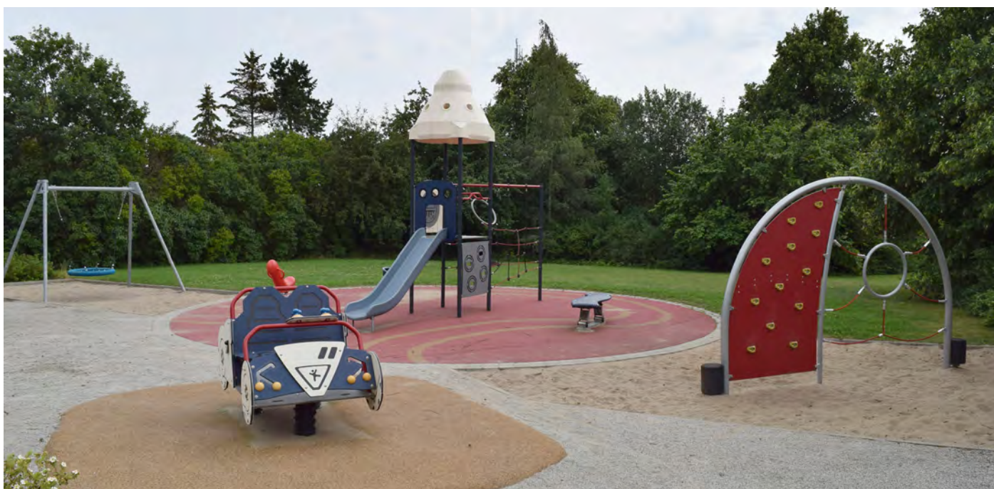
Figur 1. Rälsvägen lekplats i Löberöd är en av de kommunala lekplatserna med god kvalitet.

långsiktigt ska vägleda i det fortsatta arbetet med lekplatser på avdelningen för Gata, trafik och park och kontinuerligt kunna användas som ett underlag till budget. Planen berör de lekplatser som finns på allmän platsmark och lekplatser på kvartersmark som vid bostadshus och skolgårdar ingår inte. Lekplatsplanen inleds med planeringsförutsättningar om regler, forskning och erfarenheter. Därefter presenteras den kunskapsinsamling som har gjorts med anledning av planens framtagande vilket sedan följs av sex mål för lekplatserna och en utvecklingsplan över befintliga och nya lekplatser. Avslutningsvis dras riktlinjer för hur lekplatsplanen bör följas upp.