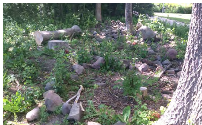
Figur 2. Det som vuxna kan uppfatta som en stökig miljö kan för barn vara en stimulerande plats med högt lekvärde. Här är ett exempel från Norr lekplats i Eslöv.

Utformningen av lekplatser bör ta hänsyn till genusaspekter då undersökningar har visat att från åtta års ålder blir lekplatserna till 80 procent pojkbarnas (Ottosson et al. 2019). I utformningen är det bra med inslag av vegetation och grönska som är könsneutralt kodat och i sådana miljöer leker barn oavsett kön och ålder med varandra i större utsträckning än på traditionella lekredskap (Boverket 2015). Samtidigt är det inte önskvärt att helt undvika könskodade inslag då det brukar leda till att kvinnliga och andra erfarenheter försvinner