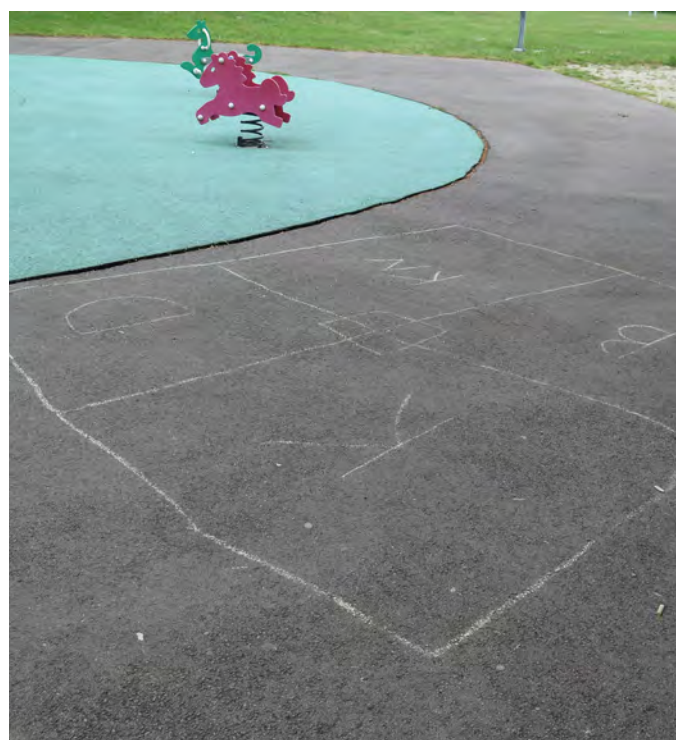
Figur 5. Det är bra när barn får möjlighet att skapa i lekmiljön. Vid Hemmansvägen lekplats finns en handritad bollplan som får vara kvar tills att regnet suddar ut den.

En framtida utveckling av lekplatser kan också vara mer integrerad digital teknik med ljus och ljud. Genom att använda det intresse som många barn har för digitala medier i lekplatser kan de ge ännu mer lekgädje. Digifys är ett forskningsprojekt där man testat och undersökt denna möjlighet (Pysander 2018). Projektet har utgått från den forskning som finns kring lekvärde i miljöer med naturinslag och därefter har tillägg gjorts i form av digital teknik som bjuder in och skapar engagemang, ger möjlighet till att påverka innehåll och att få återkoppling i leken. I deras studier har