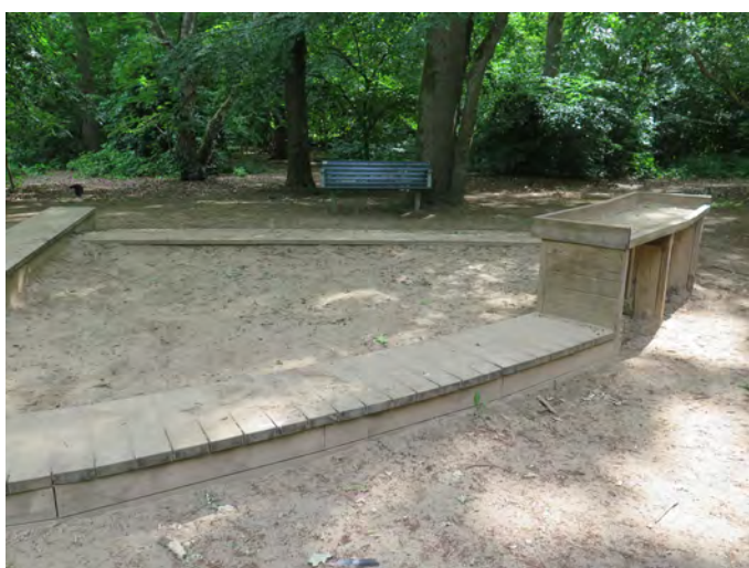
Figur 4. Vid Trollsjön lekplats finns en stor sandlåda placerad i skugga. Sandbordet gör att fler kan leka här.