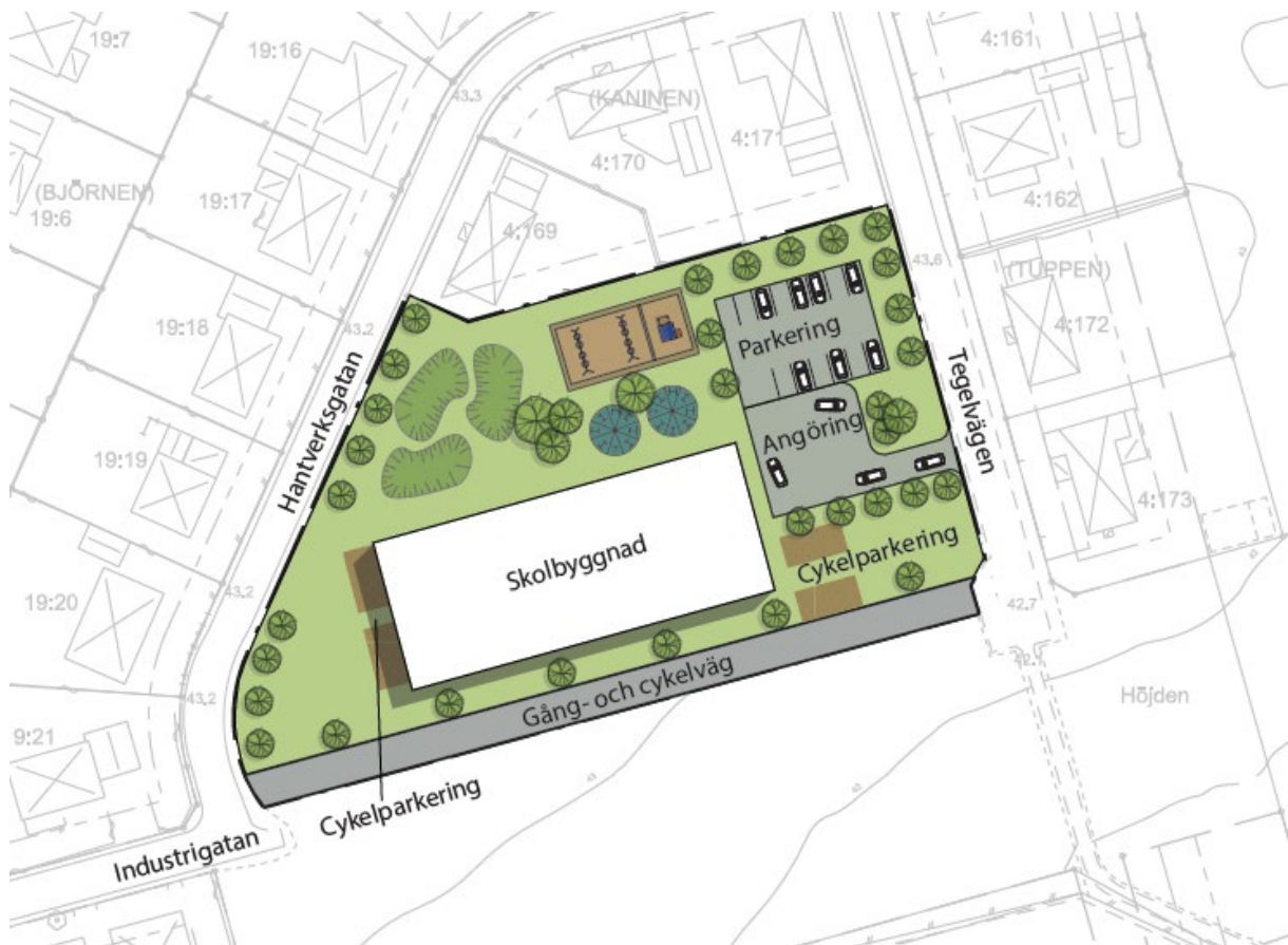
Figur 3: Schematisk bild över ett av flera tänkbara utbyggnadsalternativ som detaljplanen möjliggör.