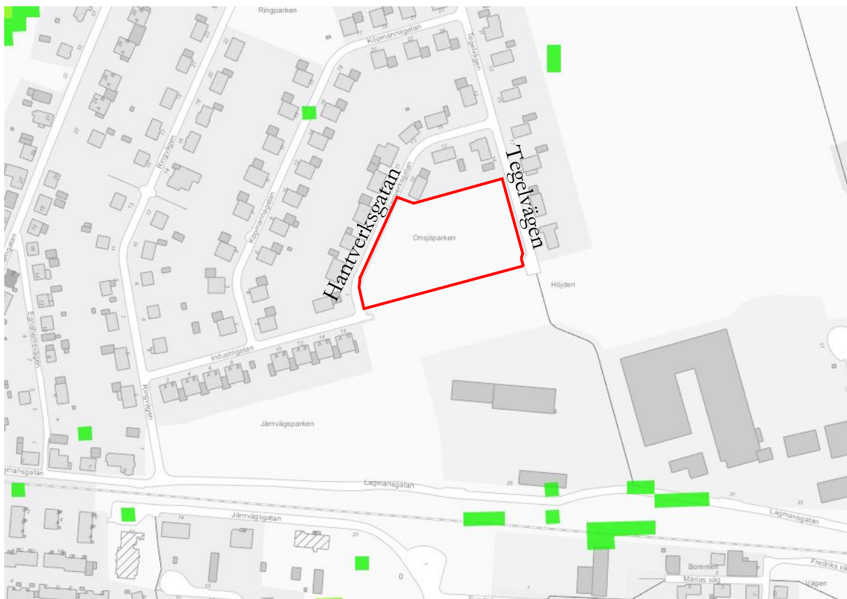
Figur 4: Illustration över lågpunkter i planområdets närhet. Gröna punkter illustrerar lågpunkter på 0,1–0,5 m. Planområdet är inom röd heldragen linje.

Detaljplanens genomförande kommer att innebära en i sammanhanget marginellt högre grad av hårdgjord yta (exempelvis asfalt) jämfört med dagens situation. I samband med ny granskning av ärendet har åtgärder vidtagits för att förbättra situationen för dagvatten inom planområdet. Se under rubrik dagvatten under PLANFÖRSLAG.