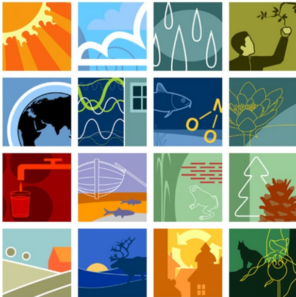
Figur 1 De 16 nationella miljömålen är en viktig grund för avfallsplanens mål och handlingsplanens åtgärder. Genomförandet av avfallsplanen och dess handlingsplan bidrar till att uppfylla flera av de nationella miljömålen.

I samverkan med bland andra de skånska kommunerna har länsstyrelsen i Skåne tagit fram ett regionalt handlingsprogram, Tillsammans för ett hållbart Skåne , med åtgärder som ska bidra till att miljömålen uppfylls. De regionala åtgärder som hanterar frågor inom ramen för avfallsplanens avgränsning har lyfts in i avfallsplanen i de fall det har bedömts lämpligt. Det gäller dock inte åtgärder som innebär tillsyn enligt miljöbalken.