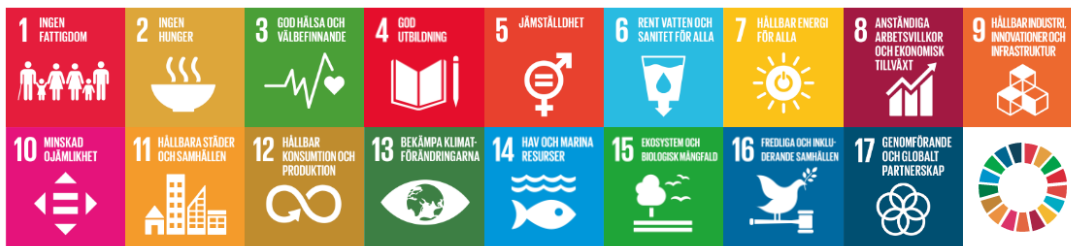
Figur 2 Genomförandet av avfallsplanen bidrar till att uppfylla flera av de globala hållbarhetsmålen.