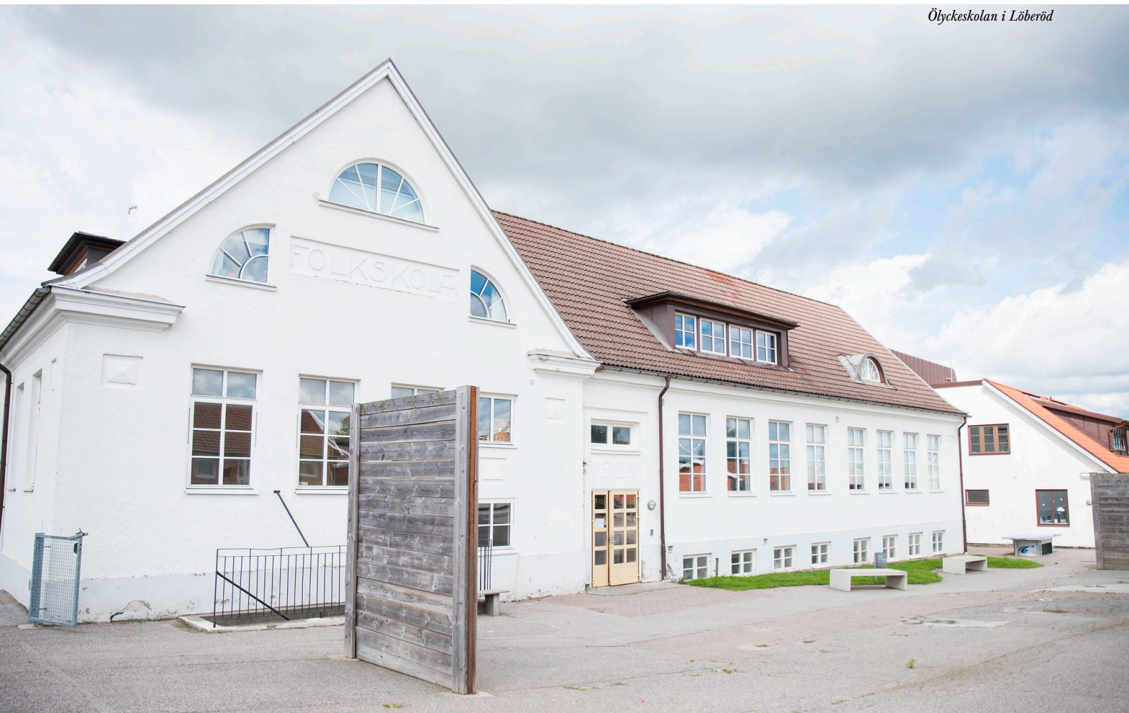
Ölyckeskolan i Löberöd