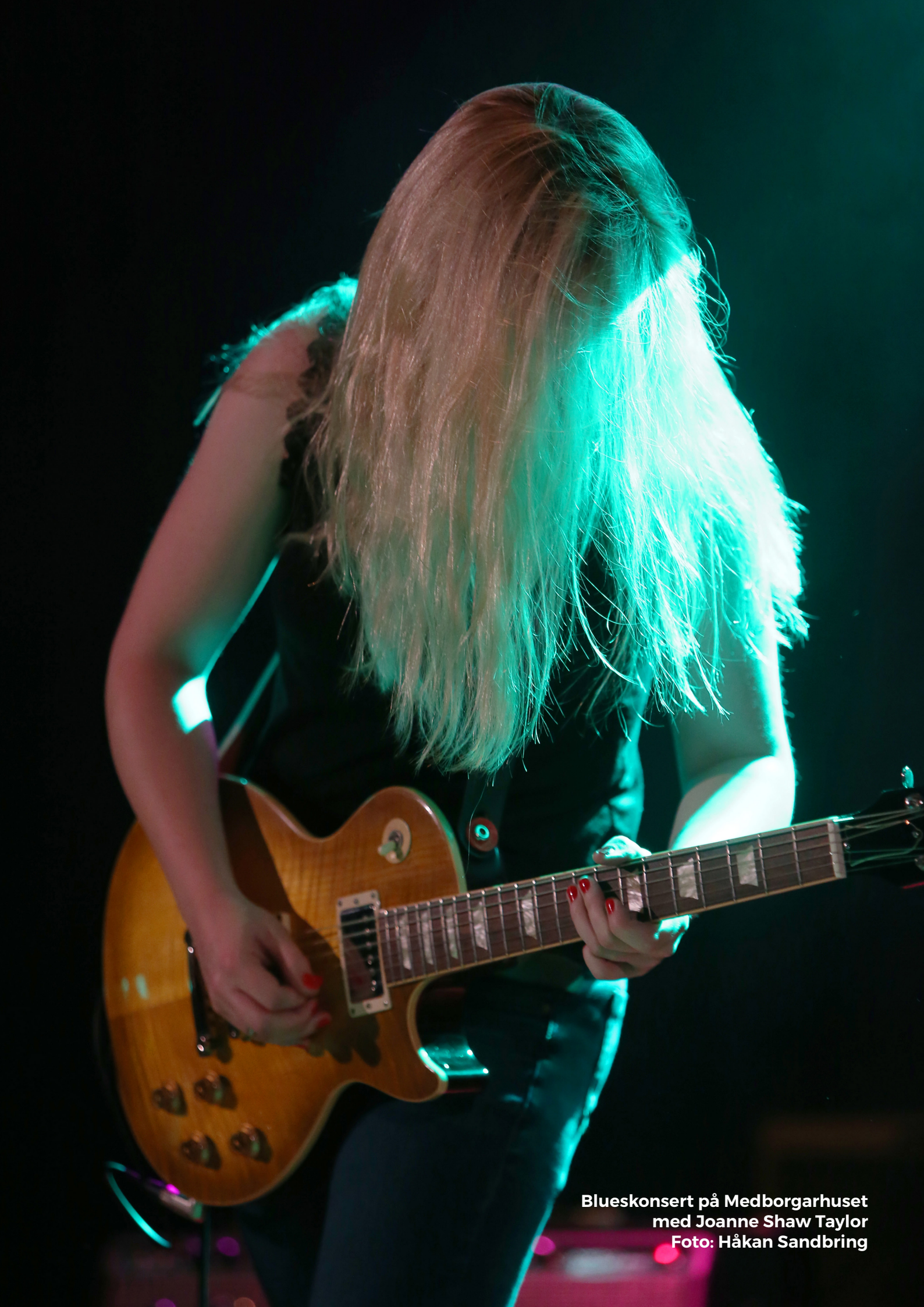
Blueskonsert på Medborgarhuset med Joanne Shaw Taylor