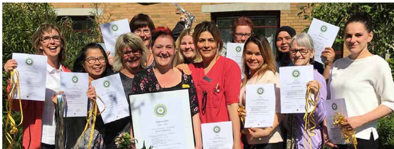
Som första boende i Eslövs kommun har avdelning två på Kärråkra demensboende tilldelats diplomert Stjärnmärkt för genomförd utbildning inom personcentrerad demensvård.