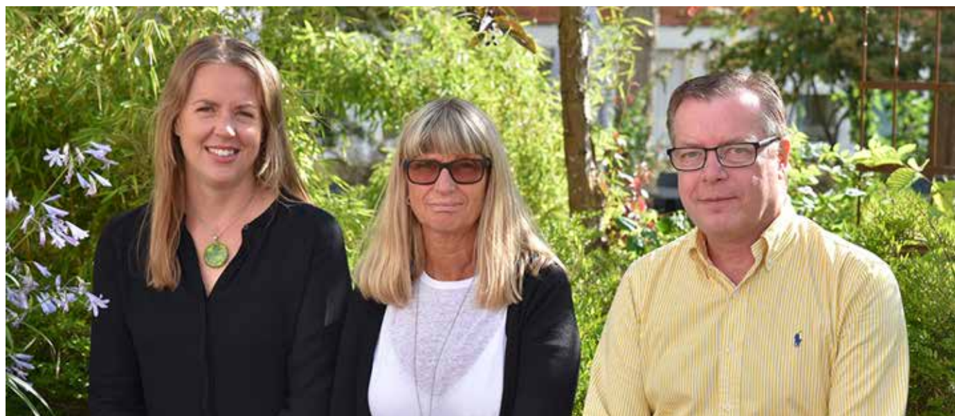
Eslövs kommun får 3,5 mnkr från Europeiska socialfonden, ESF, för att under tre år jobba med de ungdomar som har störst svårigheter att ta sig in på arbetsmarknaden eller studera.

Ovanstående äskanden finns inte med i det redovisade underskottet och inte heller i de prognoser som redogörs för i denna delårsrapport.