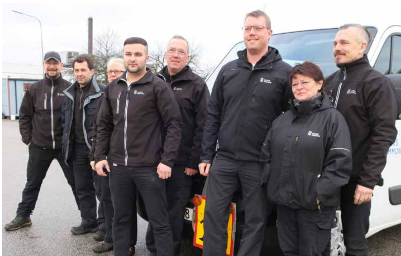
Eslövs kommun anställde egna chaufförer som transporterar både elever till och från förskolor och skolor och mat från tillagningskök till olika verksamheter. Detta otraditionella samarbete har under året nominerats till Götapriset 2019 – bästa utvecklingsprojekt inom offentligt finansierade verksamheter.