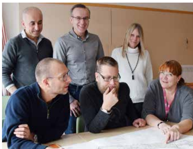
Några av medarbetarna på kart- och bygglovsavdelningen.