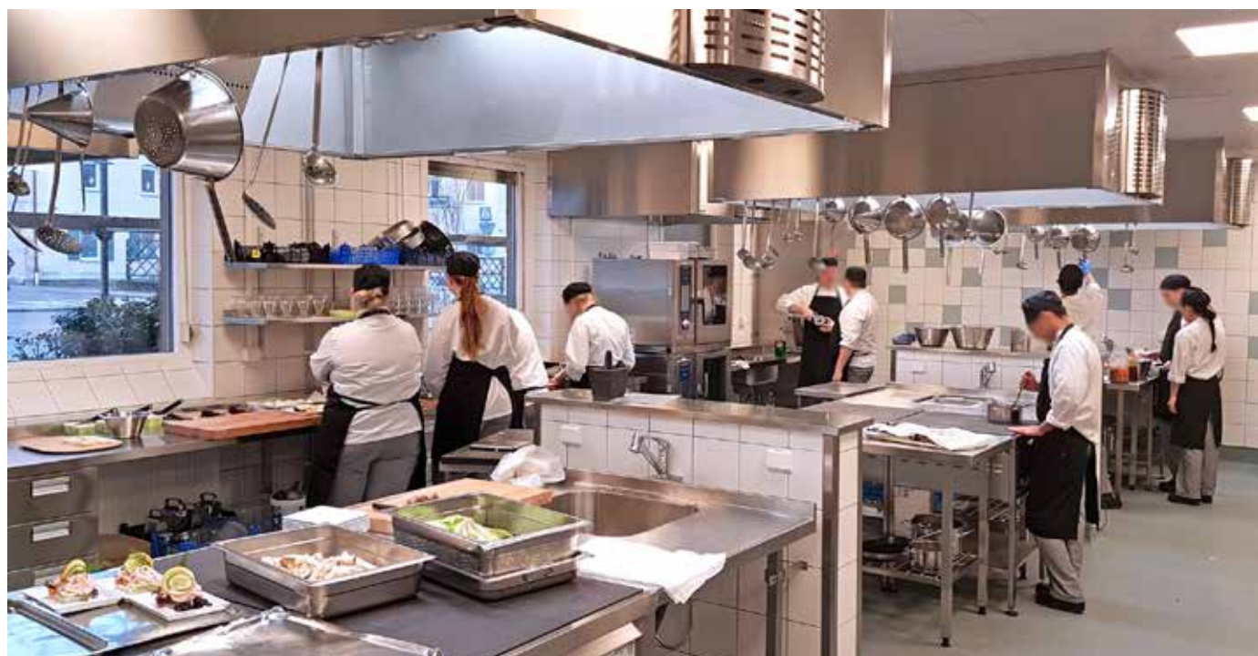
Den elevdrivna restaurangen, Restaurang No 15 har fått nya lokaler. I princip allt är nytt – nya maskiner, nya lokaler och ny inredning. Det enda som är kvar sedan tidigare är ytterväggarna och adressen, Östergatan 15.