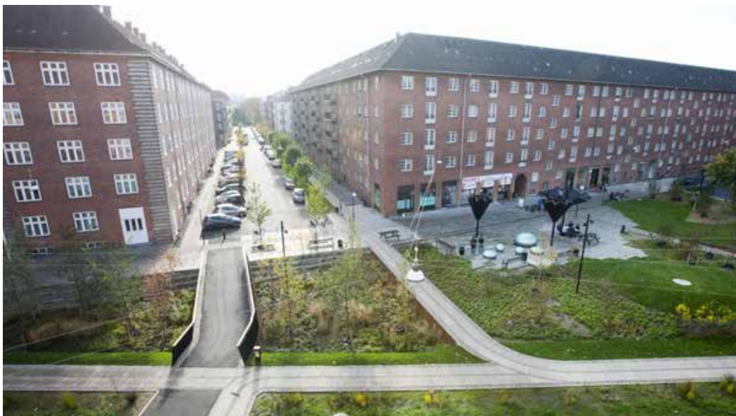
Tåsinge plads i Köpenhamn, en del av projektet Klimat kvarter Østerbro (Københavns Kommune /Charlotte Brøndum, 2015)

Multifunktionella ytor är skapade med fler syften än skyfallshantering i åtanke. Ett klassiskt exempel är en nedsänkt fotbollsplan som fungerar som just en sådan i torr väderlek men kan fungera som fördröjningsyta under ett skyfall. Mer omfattande exempel kan innefatta ytor för rekreation, lek, rening av regnvattnet och pedagogiska syften. Nedan beskrivs två exempel på multifunktionella ytor som anpassats väl till sin omgivning och dess speciella förutsättningar och utmaningar.