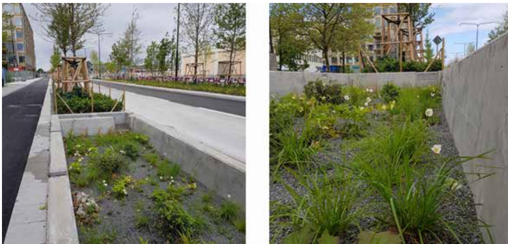
Biofilter längs Neptunigatan, Malmö (Helena Norlander, 2019)

En dagvattenlösning som har börjat bli vanligare på senare tid är biofilter, även kallade rainingardens. Fokus med denna typ av lösning ligger på rening snarare än fördröjning. Biofiltret utgörs generellt av en nedsänkt växtbädd dit dagvattnet leds och där det får infiltrera genom ett flertal olika lager av främst naturliga filtermaterial. Ofta anläggs biofilter i nära anslutning till gator eller byggnader för att samla upp dagvatten direkt från gatan eller stuprören från intilliggande tak. Det renade dagvattnet rinner sedan vidare och ut i dagvattensystemet. En stor fördel med biofilter är att de tar förhållandevis lite plats i anspråk i stadsmiljön. Det är inte ovanligt med biofilter nedsänkta i refuger eller längs med cykelbanor. Förutom reningseffekten bidrar de även till att försköna stadsbilden. I exemplet syns biofilter längs Neptunigatan i Malmö stad som tagits fram av VA SYD och Luleå Tekniska Universitet. Dessa ingår i ett forskningsprojekt och de är utformade för att även mäta kvalitet på det utgående vattnet.