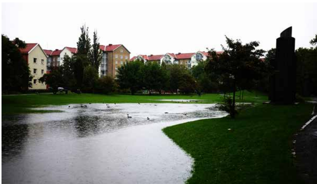
Augustenborg, Malmö efter ett kraftigt skyfall 2014