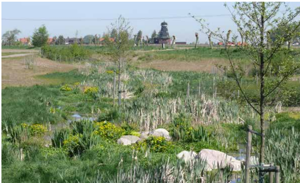
Våtmark i Tygelsjö ekostråk, Malmö

Våtmarken är en bra dagvattenlösning som kombinerar både rening och fördröjning, men historiskt har den främst använts till rening av jordbruksvatten från näringsämnen som kväve och fosfor. En välde-signad våtmark består av ett flertal genomtänkta komponenter, till exempel växtzoner, som vattnet kan sila igenom och näringsämnen tas upp. Även omväxlande djupa och grunda delar bidrar till syresättning och sedimentation av partiklar vilket hjälper till att rena vattnet. Våtmarken tar ofta en del yta i anspråk men kan i gengäld fördröja större volymer vatten.