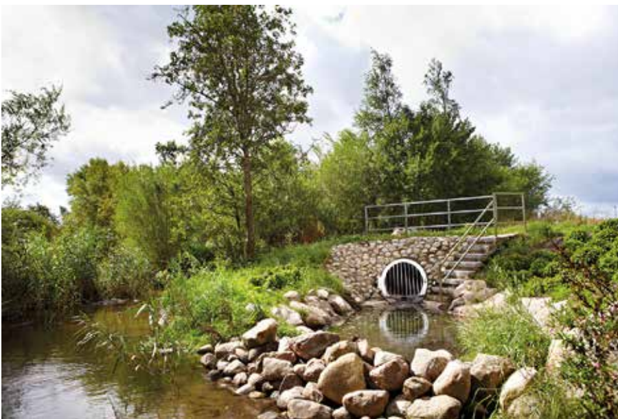
Exempel på en dagvattenlösning.

Målen är av två olika typer. De två förstnämnda fokuserar på att ta hand om dagvatten och skyfall på ett sätt som ger så liten störning som möjligt på miljö i vatten och mark samt minskar risken för skador. De två sistnämnda berör aspekter som ökad kunskap och bättre planeringsprocesser.