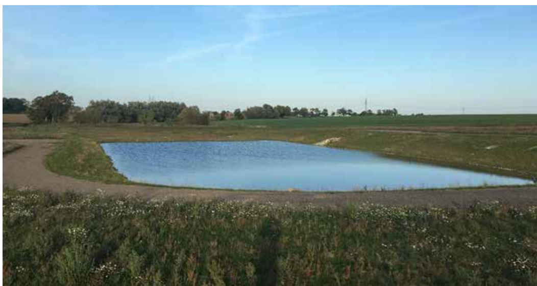
Gränsdammen i norra Åkarp, Burlövs kommun (Cornelia Wallner, 2018)

En av de vanligaste dagvattenlösningarna är fördröjningsmagasinet, även kallat dagvattendamm. Som namnet antyder är dess primära funktion att fördröja dagvatten för att på så sätt minska belastningen på det nedströms belägna ledningsnätet. Principen bygger oftast på att magasinet har ett fysiskt begränsat utlopp vilket gör att det fylls upp under ett kraftigare regn men bara släpper vidare ett givet utflöde. Tack vare magasinvolymen kan alltså det nedströms belägna ledningsnätet hantera regnmängderna även om de faller på kort tid, det vill säga med hög intensitet. Fördröjningsmagasin är vanligast i form av öppna dagvattendammar men finns också i form av