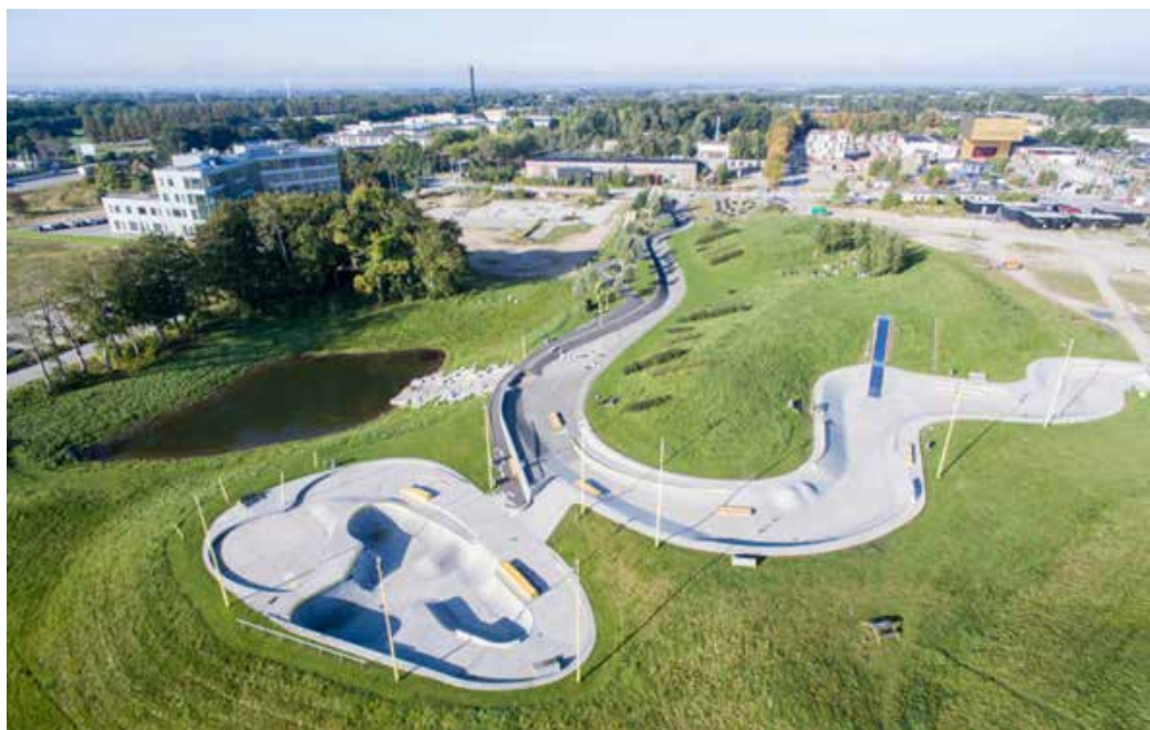
Rabalderparken i Roskilde, en del av stadsdelen Musicon där en skejtpark används för dagvattenhantering (GHB Landskapsarkitekter / Jacob Borg Damkjær, 2017)

ten från omkringliggande takytor. Torget hanterar både dagvatten- och skyfall. Det är en multifunktionell yta där det bland annat finns pedagogiska lekytor där barn (och vuxna) kan pumpa upp vatten och följa vattnets väg. Platsen erbjuder även grönytor för rekreation och umgänge (Københavns Kommune, 2014).