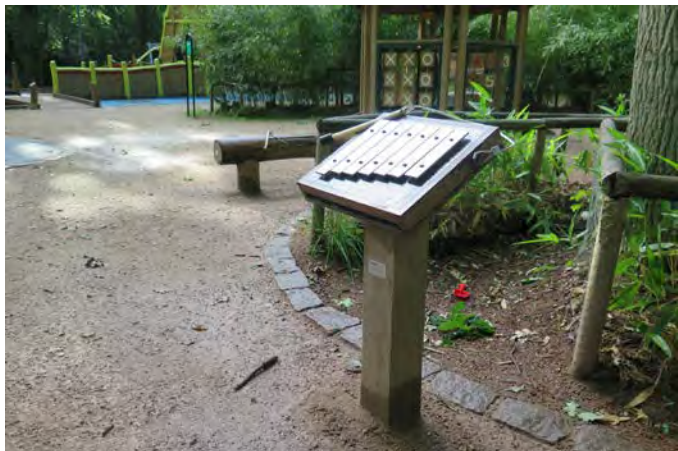
Figur I. Vid Trollsjön lekplats går det att spela på instrument och utforska sina sinnen (26).