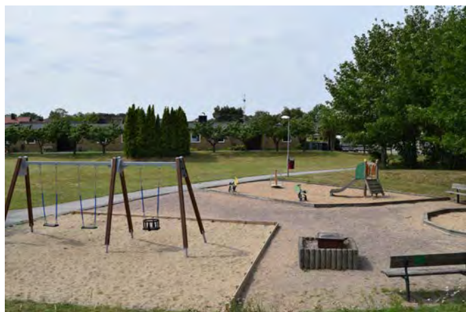
K1 Kungshult lekplats (Hasslerödsvägen)

Målgrupp och storlek: Lekplatsen klassificeras som en närlekplats, men lekutrustningen är inte anpassad för barn upp till 12 år. I dagsläget går utmaning att finna i exempelvis klätterträd. Ny lekutrustning bör locka lite äldre barn.