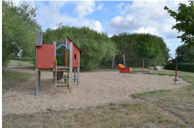
E9 Solkullen lekplats (Pål Jens väg, Eslöv)

Målgrupp och storlek: Lekplatsen klassificeras som en närlekplats, men saknar lekutrustning som kan tänkas locka barn upp till 12 års ålder.