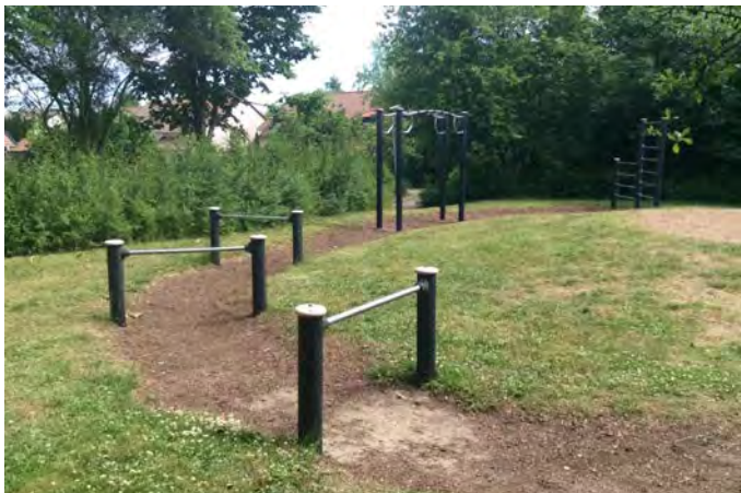
Figur E. Hinderbana vid Fridasro lekplats inbjuder till rörelse för både barn och vuxna (20).