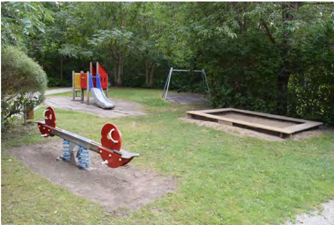
M2 Sundelius Park lekplats (Storgatan/ Sundelius Park, Marieholm)

Målgrupp och storlek: Lekplatsen klassificeras som en närlekplats, men bör göras om till en områdeslekplats som kan locka barn i alla åldrar.