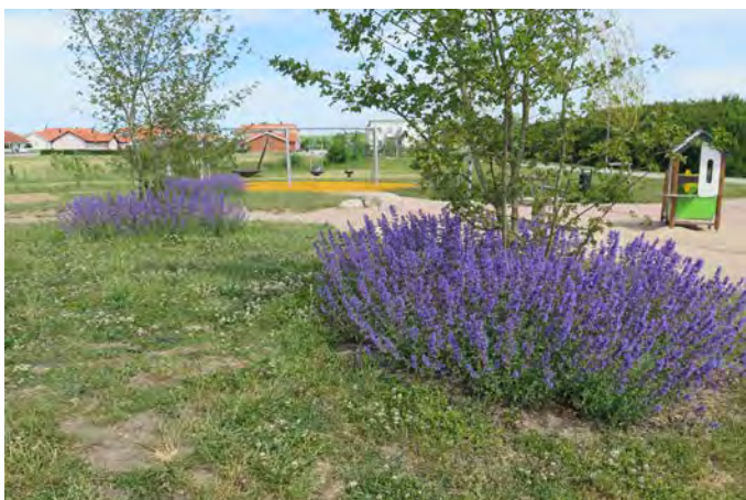
Figur K. Exempel på flertal ekosystemtjänster finns vid Bäckdala lekplats med blommande växter som lockar pollinatörer och öppen dagvattenhantering (28).