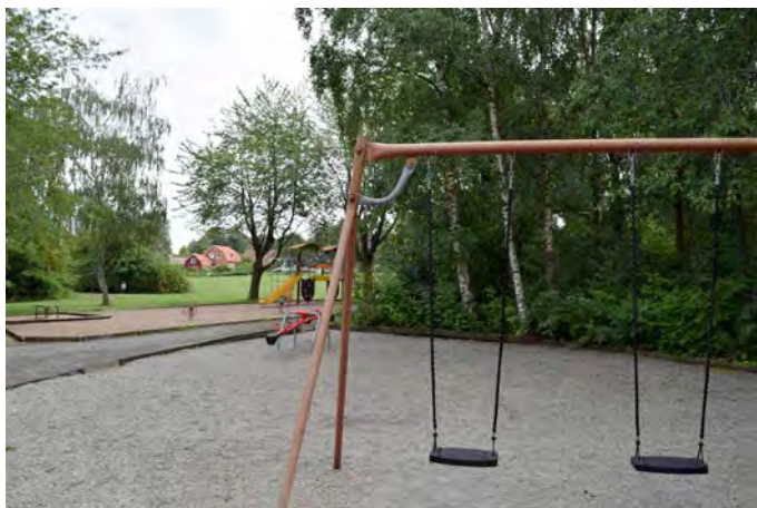
HU1 Hurva lekplats (Mantalsvägen)

Målgrupp och storlek: Lekplatsen klassificeras som en närlekplats och uppfyller alla kriterier för den kategoriseringen.