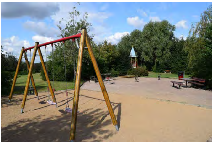
S1 Värlinge Backe lekplats (Gränsbovägen, Stehag)

Målgrupp och storlek: Lekplatsen klassificeras som en närlekplats, men tack vare omgivande parkmiljö kan både fler och äldre barn tänkas vistas här.