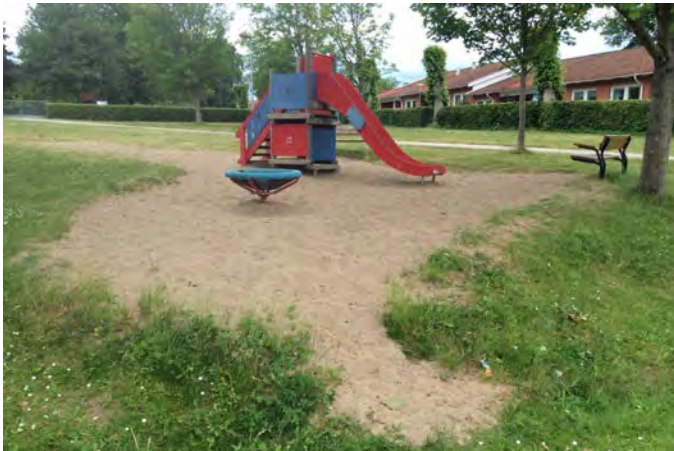
L3 Ölycke lekplats (Ölyckevägen, Löberöd)

Målgrupp och storlek: Lekplatsen klassificeras som en närlekplats och bör vid upprustning bli en områdeslekplats.