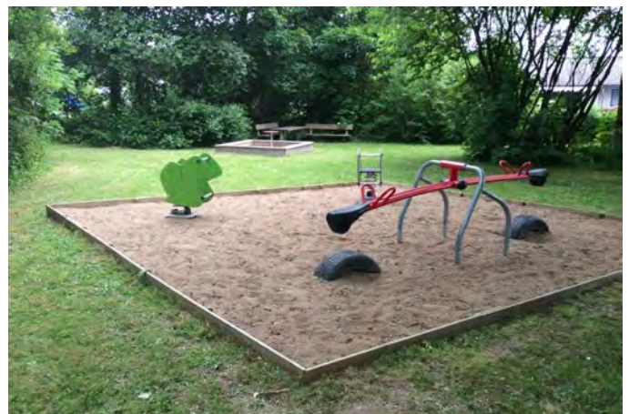
Figur B. Stockamöllan lekplats har rumsligheter som är en förutsättning för att både lek, möten och avkoppling ska kunna förekomma samtidigt på en plats (16,19).