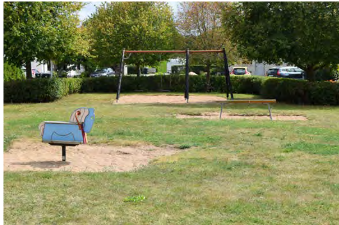
G1 Gårdstånga lekplats (Byasvängen)

Målgrupp och storlek: Lekplatsen klassificeras som en närlekplats, men lekutrustningen är inte anpassad för barn upp till 12 år. Detta bör ses över i samband med att lekplatsen görs om.