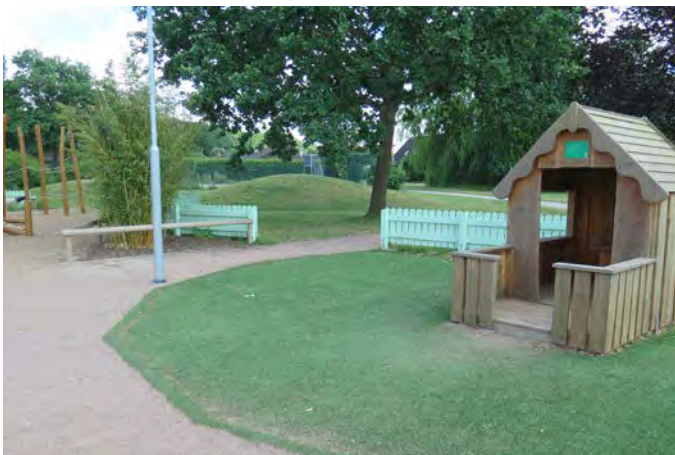
Figur A. Tillgängliga gånger och konstgräs gör att Hällan lekplats kan användas utav fler (11, 30).