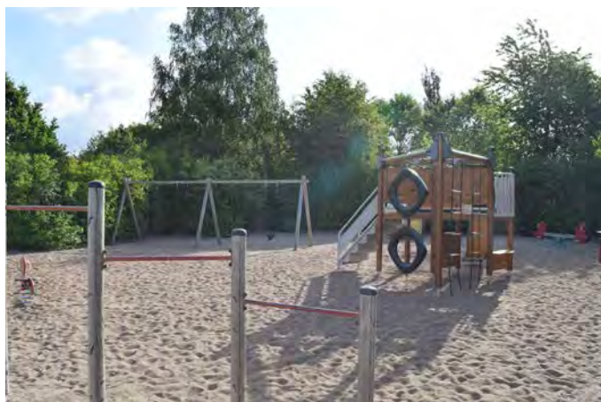
E5 Äselunden lekplats (Äsevägen, Eslöv)

Målgrupp och storlek: Lekplatsen klassificeras som en närlekplats, men med den omgivande miljön inräknad kan även äldre barn uppskatta lekmiljön.