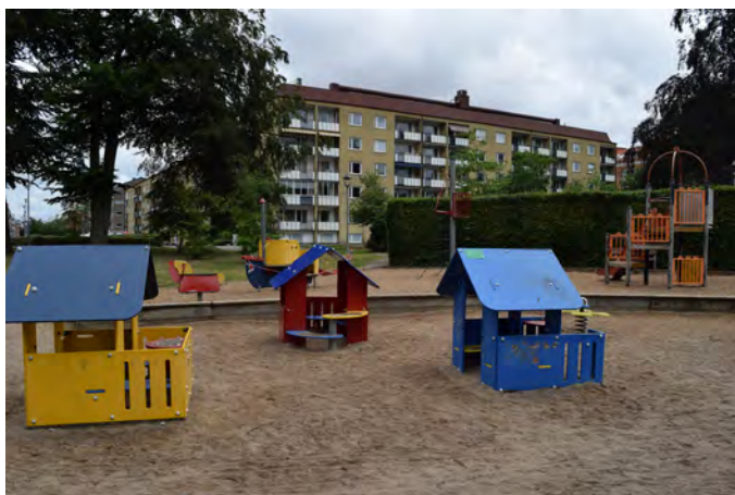
E1 Stadsparken lekplats (Kyrkogatan, Eslöv)

Målgrupp och storlek: Lekplatsen klassificeras idag som en närlekplats, men bör utifrån antal barn i närheten utvecklas till en områdeslekplats.