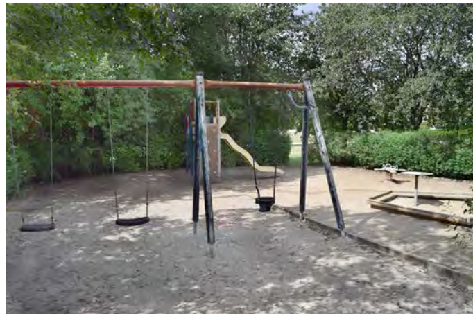
M1 Ringparken lekplats (Köpmansgatan/Ringvägen, Marieholm)

Målgrupp och storlek: Lekplatsen klassificeras som en närlekplats och uppfyller alla kriterier för den kategoriseringen.