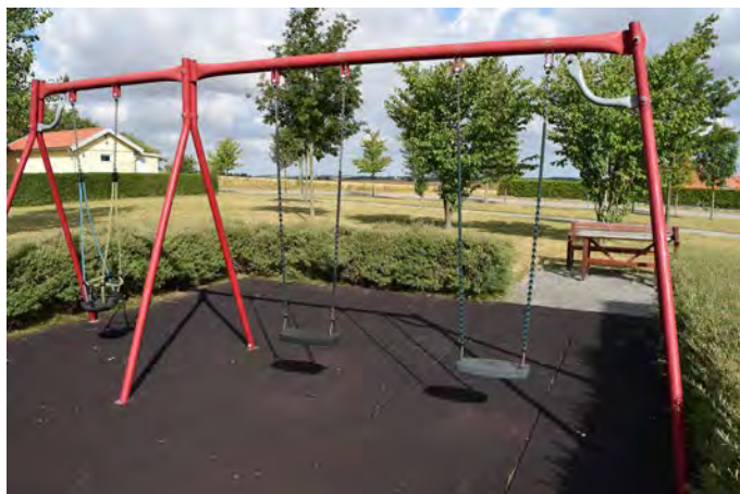
E12 Elvkullen lekplats (Vetegatan, Eslöv)

Målgrupp och storlek: Lekplatsen saknar de kvalitéer som krävs för att räknas som en närlekplats.