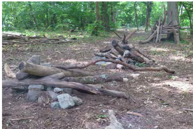
Figur J. Vid Trollsjön lekplats finns löst material i form av stenar och pinnar (27).