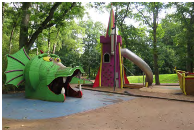
Figur L. Lekutrustning vid Trollsjön lekplats är platsbyggd (29).