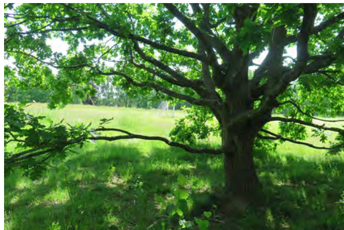
Figur H. Vid Äselunden lekplats finns flera ekar som det går bra att klättra i (24).