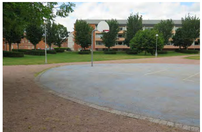
Figur D. Vid Badhusparken lekplats finns en basketplan som inte tar upp mer än halva ytan, vilket är bra ur ett genusperspektiv (18).