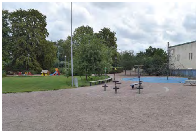
E6 Badhusparken lekplats (Glasgränd, Eslöv)

Målgrupp och storlek: Lekplatsen klassificeras som en områdeslekplats och uppfyller alla kriterier för den kategoriseringen.