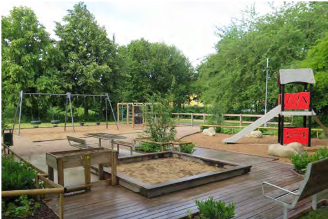
E7 Stallhagen lekplats (Vallarevägen, Eslöv)

Målgrupp och storlek: Lekplatsen klassificeras som en närlekplats och uppfyller alla kriterier för den kategoriseringen.