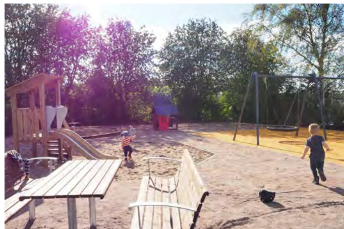
VI Väggarp lekplats (Barnekows väg)

Målgrupp och storlek: Lekplatsen klassificeras som en närlekplats och miljön kan tänkas locka barn upp till 12 år.