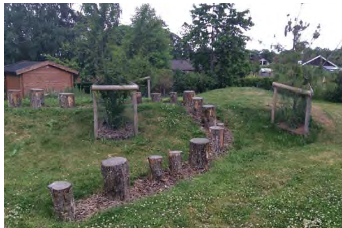
Figur F. Hinderbana vid Billinge lekplats, ett exempel på hur lekutrustning integreras i landskapet genom att utnyttja topografin (22).