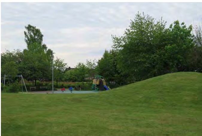
Figur C. Hemmansvägen lekplats är en av många som ligger i en parkmiljö där det både finns oprogrammerade ytor och varierad topografi (17, 21).