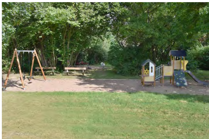
ST1 Stockamöllan lekplats (Fräsarevägen)

Målgrupp och storlek: Lekplatsen klassificeras som en närlekplats, men saknar lekutrustning som lockar barn upp till 12 år.