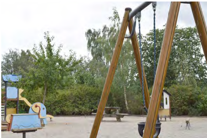
F1 Flyinge lekplats (Gullregnsvägen/Äppelvägen)

Målgrupp och storlek: Lekplatsen klassificeras som en närlekplats, men lekutrustningen är inte anpassad för barn upp till 12 år även om omgivningen delvis kompenserar för det. Lekplatsen bör göras om till en områdeslekplats.