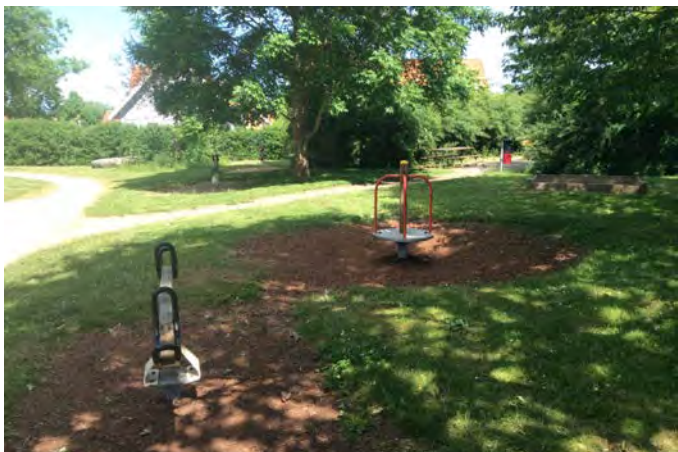
Figur G. Norr lekplats. Där barn vistas mest täcks minst hälften av himlen av vegetation (23).