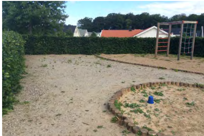
S2 Havregatan lekplats (Stehag)

Målgrupp och storlek: Lekplatsen klassificeras som en närlekplats, men utrustning och utformning begränsar attraktionsvärdet för äldre barn.