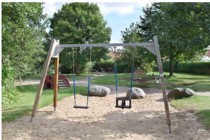
E13 Norr lekplats (Klippanvägen, Eslöv)

Målgrupp och storlek: Lekplatsen klassificeras som en närlekplats. Bollplaner finns i närheten och kan locka personer i alla åldrar.