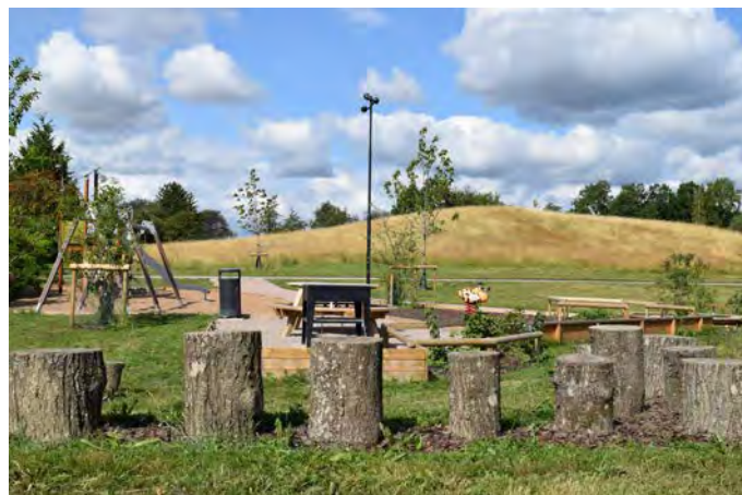
B1 Billinge lekplats (Getabjer)

Målgrupp och storlek: Lekplatsen klassificeras som en närlekplats och uppfyller alla kriterier för den kategoriseringen.