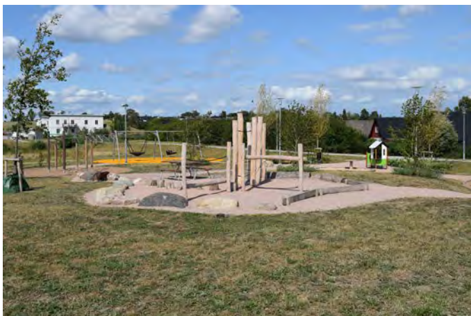
E17 Bäckdala lekplats (Skålpundsvägen, Eslöv)

Målgrupp och storlek: Lekplatsen klassificeras som en närlekplats.