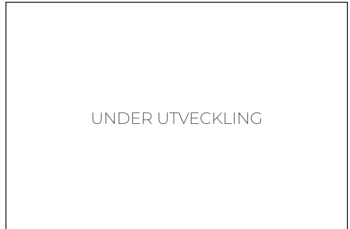
E11 Rönneberga lekplats (Sextorpsvägen, Eslöv)

Målgrupp och storlek: Efter att lekplatsen har gjorts om kommer den uppfylla kriterierna för en områdeslekplats.