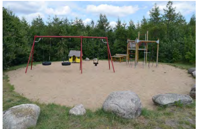
M3 Puggeängen lekplats (Klaragatan, Mariteholm)

Målgrupp och storlek: Lekplatsen klassificeras som en närlekplats och uppfyller alla kriterier för den kategoriseringen även om lekplatsen är något liten.