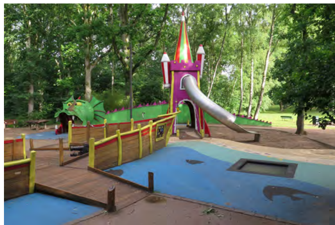
E2 Trollsjön lekplats (Trollsjögatan/Skogsvägen, Eslöv)

Målgrupp och storlek: Lekplatsen är kommunens enda utflyktslekplats. Själva lekplatsen lockar inte barn upp till 18 år, men den omgivande parken kompenserar för det.