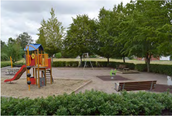
E10 Hästhoven lekplats (Norregatan, Eslöv)

Målgrupp och storlek: Lekplatsen klassificeras som en närlekplats då den kan locka barn upp till 12 år tack vare friytor runt lekplatsen inklusive bollplan.